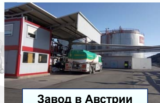
Завод в Австрии

Свинецсодержащие отходы (аккумуляторы), Ртутьсодержащие (градусники, люминесцентные лампы), Отходы химических источников тока (батарейки), Отходы химических и нефтеперерабатывающих производств, отработанные растворы кислот и солей