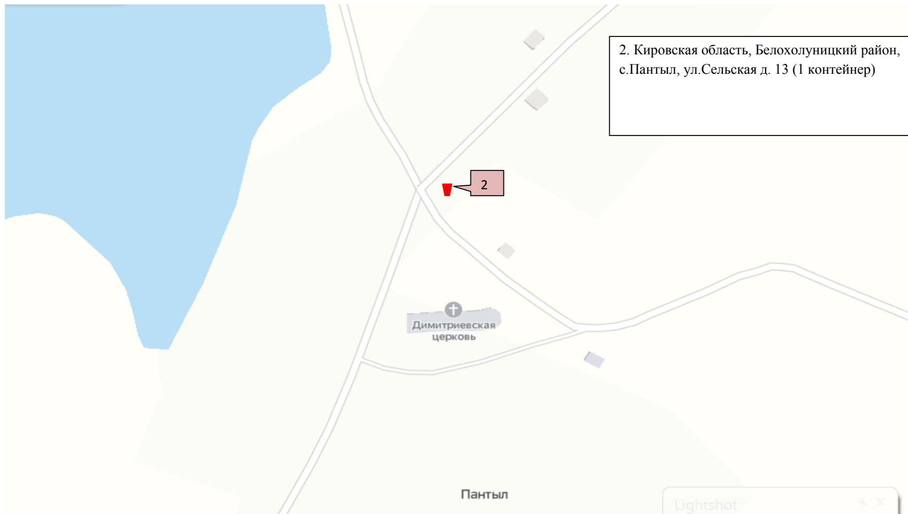
Схема размещения мест (площадок) накопления твердых коммунальных отходов Гуренское сельское поселение Белохолуницкого района (с. Пантыл)